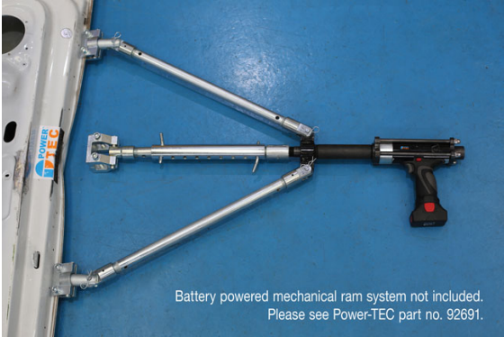
Battery powered mechanical ram system not included. Please see Power-TEC part no. 92691.